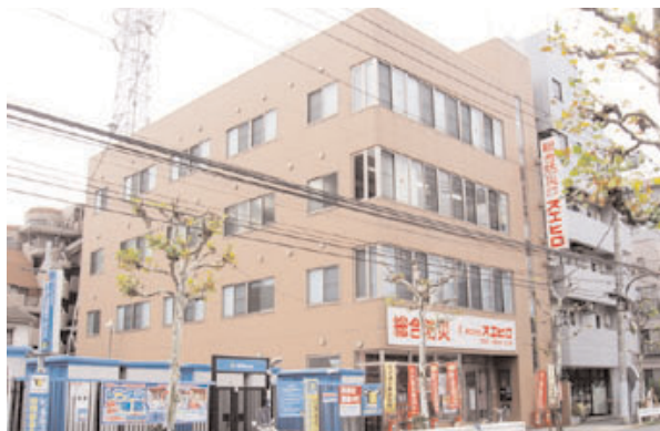
本社・城北営業所