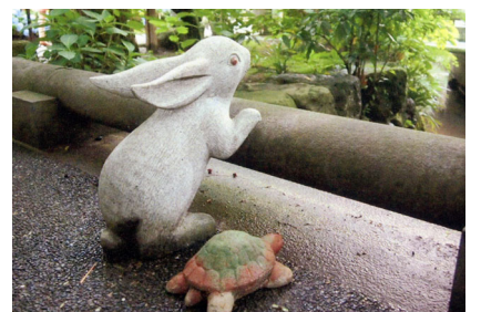
明月院のうさぎとかめの置物

今年も新型コロナウイルス感染症の収束は望めそうもありません。初詣にうさぎ神社や寺に出掛けて、しばし心にうるおいを与えてはいかがでしょうか。