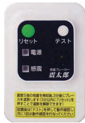
感震ブレーカー「震太郎」