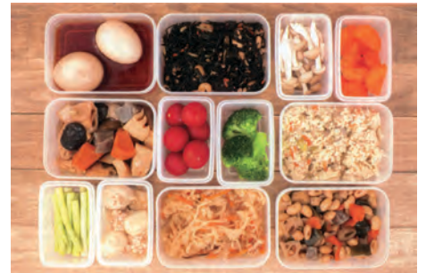
ヘルシーなおかずを作り置き